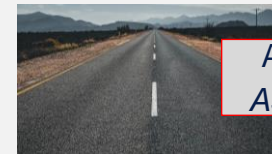
Asfalt/ Bitumen Asphalt/ Bitumen