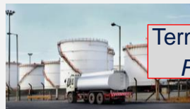
Terminale paliwowe Fuel terminals

Długoterminowe kontrakty / long-term contracts